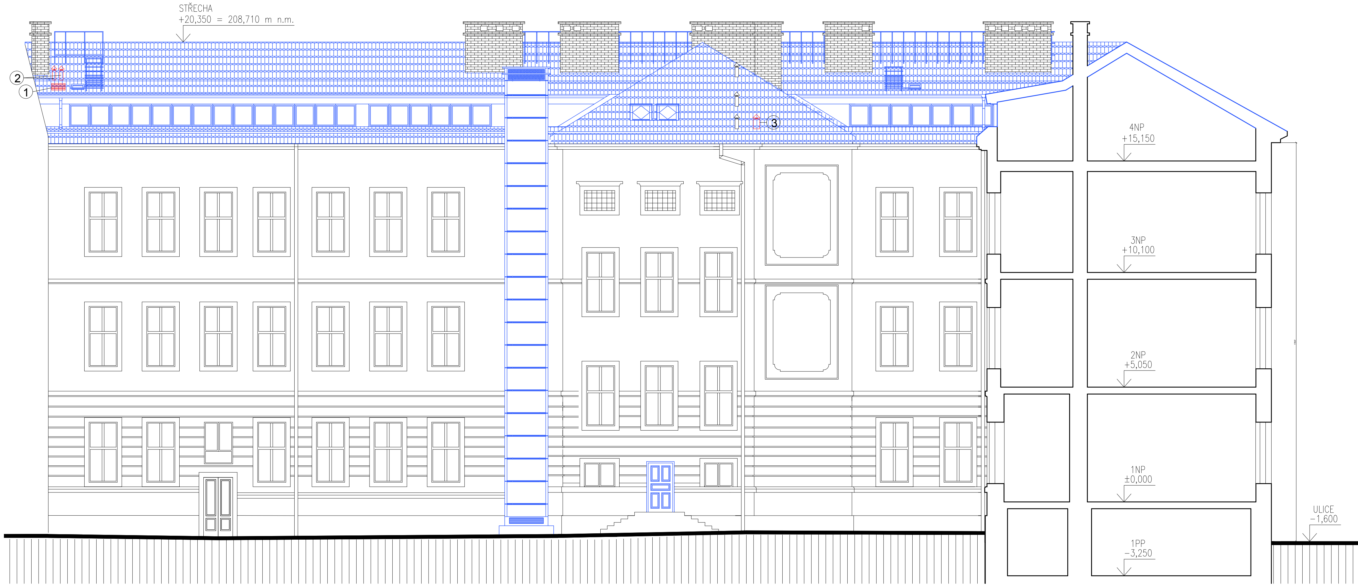
POHLED ZÁPADNÍ – DVORNÍ FASÁDA